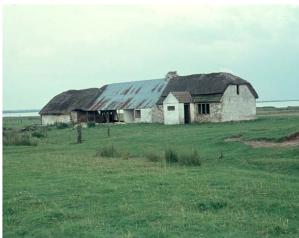
Der findes mange saneringsmodne bygninger og boliger rundt omkring i det åbne land.