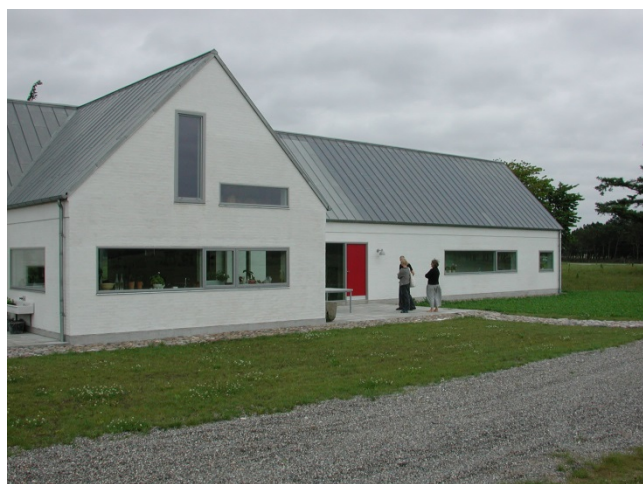
Nye attraktive boliger, som ligger naturskønt tæt på god infrastruktur og med gode bygningsmæssige, rumlige kvaliteter kan være med til at tiltrække nye beboere til det åbne land.