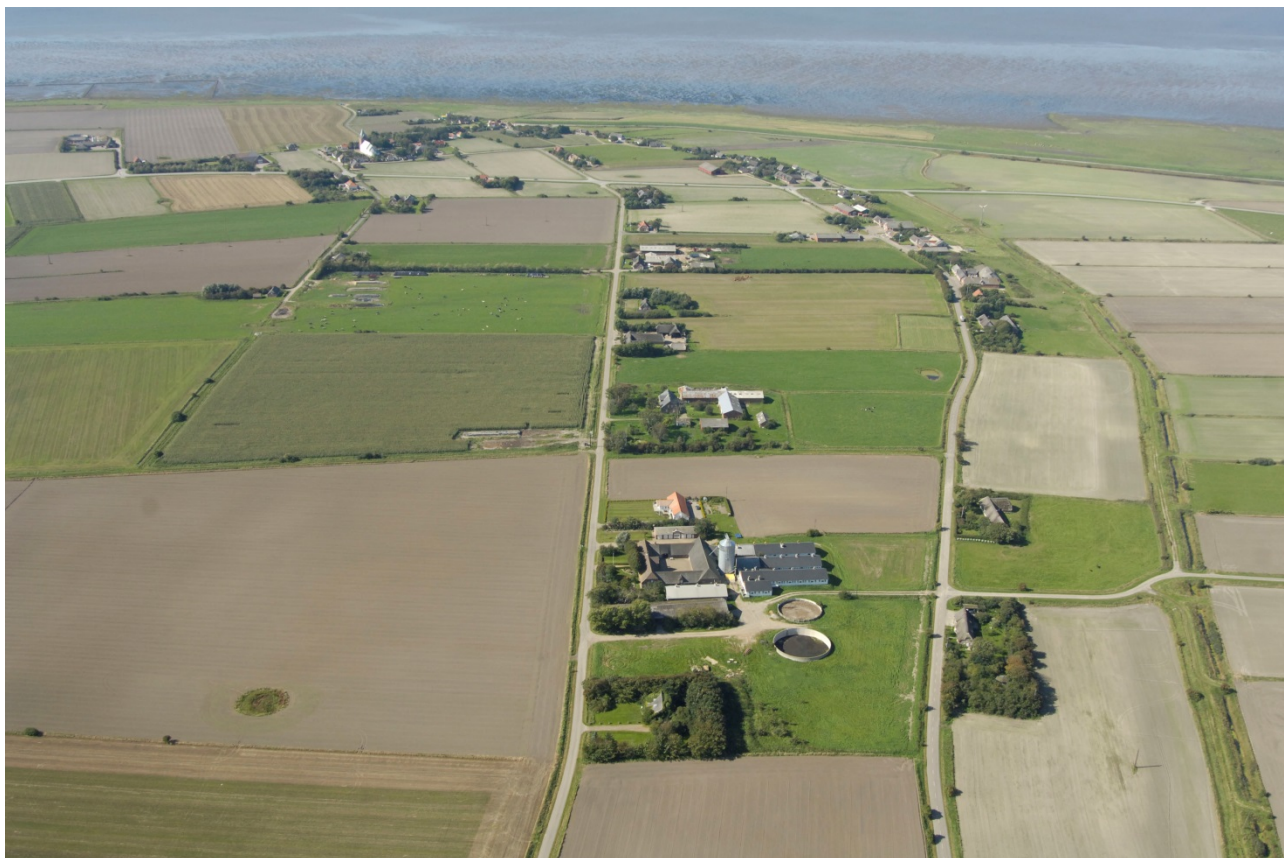
Et kulturlandskab, som viser anlægsstruktur med gårde på række langs veje og med dyrkningsarealer på bakkeøen mod venstre og et inddæmmet område til højre

og løsningsforslag til projekter som kunne tage udgangspunkt i afvikling for at skabe rum til udvikling, hvad enten det drejer sig om bosætning, natur eller erhverv.