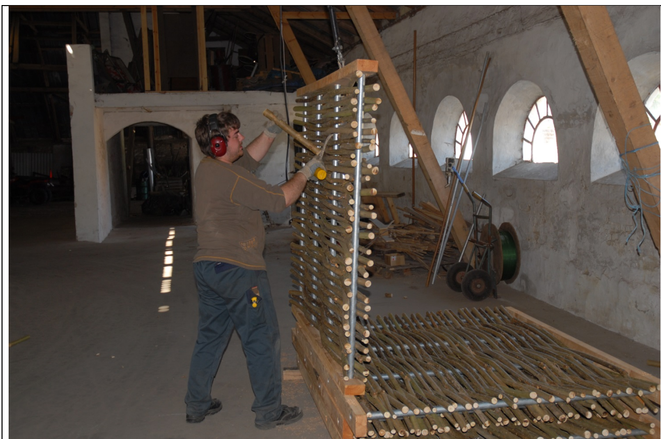
En specialproduktion af pil på gårdens jorder, viderebearbejdes til bl.a. støj og læhegn. Produktionen beskæftiger i dag på gården 6 – 8 mand.

Gode og gunstige rammer for erhvervslivet herunder landbruget kan sikre arbejdspladser og udvikling i et lokalområde.