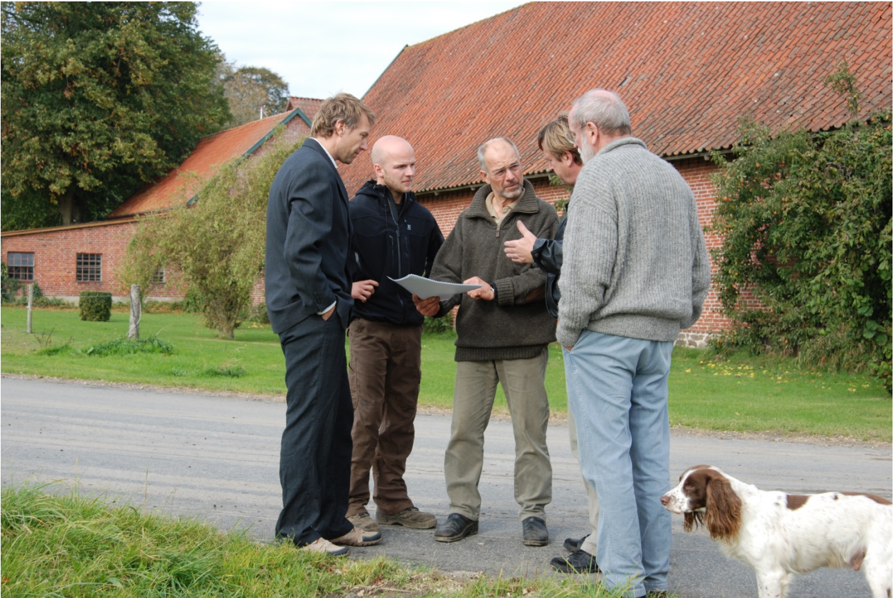
Det er vigtigt have dialog med hinanden, når der skal planlægges for og igangsættes nye projekter.